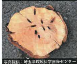
幼虫に食害された樹木の内部

公園や街路樹などのサクラ が加害されると景観が悪化し たり、お花見を楽しむことが できなくなってしまいます。