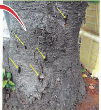
幼虫(左下)と脱出孔(右上)の写真提供: 埼玉県環境科学国際センター